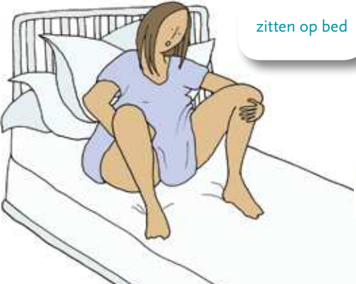
zitten op bed