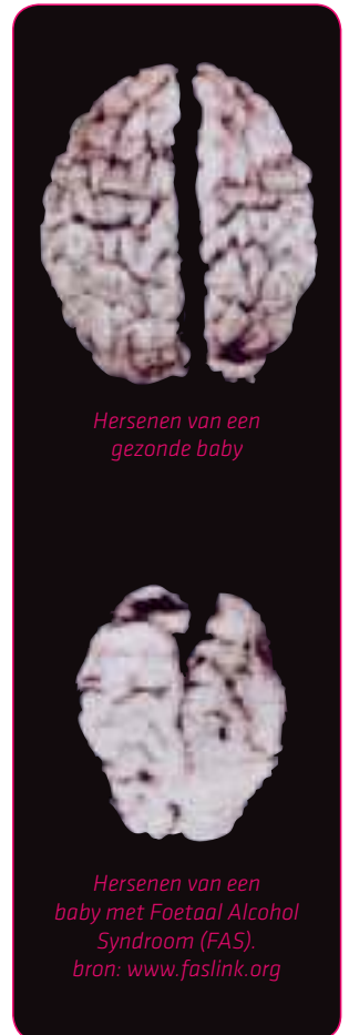
Hersenen van een gezonde baby

Tijdens de zwangerschap worden cellen aangemaakt waarmee lichaamsdelen, hersenen en andere organen groeien. Wanneer je alcohol drinkt tijdens de zwangerschap, kun je de aanmaak van die cellen verstoren. Hierdoor is het mogelijk dat sommige delen van het lichaam van je kindje niet goed groeien. Of je beschadigt organen bij je baby die al ontwikkeld zijn. Vooral de hersenen zijn kwetsbaar: die blijven de gehele zwangerschap in ontwikkeling. Daarom kan alcoholgebruik tijdens ieder moment van de zwangerschap voor hersenschade zorgen. Bij een kind kun je dan afwijkingen zien, zoals een lager IQ, leerproblemen, hyperactiviteit of gedragsproblemen.