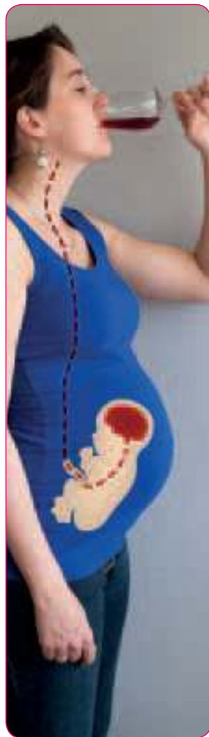
Als je alcohol drinkt, drinkt je baby mee.