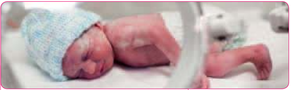
Baby in couveuse